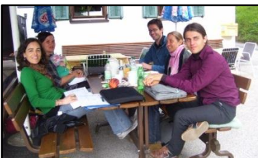
WP4 e WP5 encontram-se nos Alpes

Nossos pesquisadores do WP4 e WP5, reuniu-se perto de Kufstein-Áustria, de 2 a 4 de Junho de 2012. O objetivo principal do encontro foi a trabalhar nos instrumentos e modelos de governança para cada região de estudo de caso e planejar os próximos passos na coleta de dados. Estes aspetos foram discutidos posteriormente uma semana mais tarde, durante a reunião do Conselho de projeto em São Paulo, Brasil.