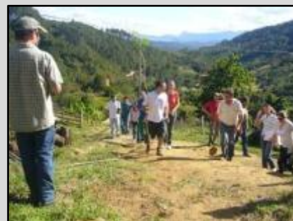
Workshop em St. Rosa de Lima

Nossos parceiros nas regiões de estudo de caso já estão estabelecendo os contatos iniciais com as potenciais regiões de transferência. Por exemplo, a fundação Neotropica, nosso parceiro na Costa Rica, iniciou o processo de assinatura de um memorando de entendimento com as partes interessadas nas duas regiões de transferência, nomeadamente Puntarenas e Manzanillo. A expectativa é de que num futuro próximo os parceiros do projecto e os grupos locais das partes interessadas nas quatro regiões de estudo de caso vão começar discutindo as estratégias de transferência, incluindo seminários de capacitação, treinamentos e viagens de campo entre as regiões de estudo de caso e as respectivas áreas de transferência.