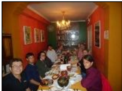
São Paulo recibe a los miembros del proyecto

Durante el primer y segundo día de la reunión fue presentado por los miembros responsables un resumen de los planes de trabajo individuales de los Paquetes de Trabajo o Work Packages (WP), comparando los resultados obtenidos y previstos, las adaptaciones y las consecuencias.