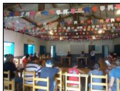
Encuentro en Marujá

En primer lugar, las entrevistas abarcaron varios temas, tales como el impacto de AMOMAR y la legislación del Parque Estatal (para el WP4) y la estructura social y los derechos de propiedad en el Parque (para el WP5). En segundo lugar, se hizo un breve cuestionario para averiguar cómo las personas de Maruja perciben su "comunidad". Y en tercer lugar, se realizaron entrevistas de pre testeo acerca de las perspectivas de turismo y participación para el futuro trabajo de campo.