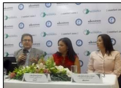
Imágenes de las conferencias de prensa de lanzamiento del Programa Carbono Azul con Volkswagen (24-05-12) y Davines (09-08-12)