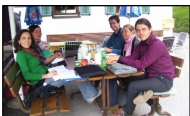
WP4 y WP5 se encuentran en Kufstein

Nuestros miembros de los grupos de investigación de WP4 y WP5, se reunieron cerca de Kufstein - Austria, del 2 al 4 junio de 2012. El objetivo principal de esta reunión fue trabajar en los instrumentos y modelos de gobernanza para cada región de los casos de estudio, y planificar los próximos pasos en la recopilación de datos. Estos temas se discutieron una semana más tarde, durante la reunión de la Junta del proyecto en São Paulo, Brasil.